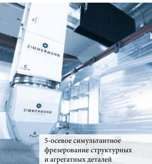
5-осевое симультантное фрезерование структурных и агрегатных деталей