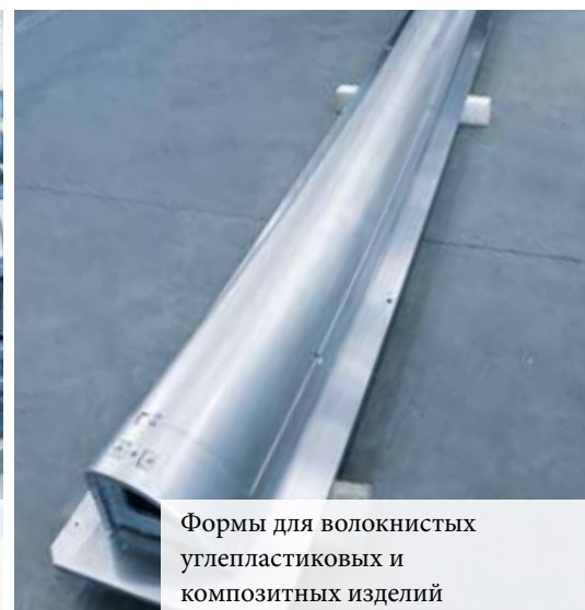
Формы для волокнистых углепластиковых и композитных изделий