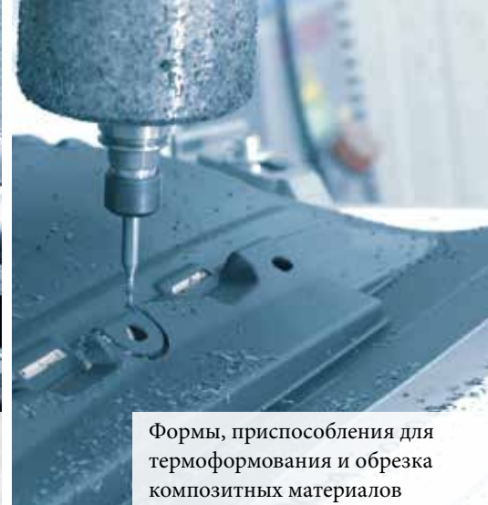
Формы, приспособления для термоформования и обрезка композитных материалов