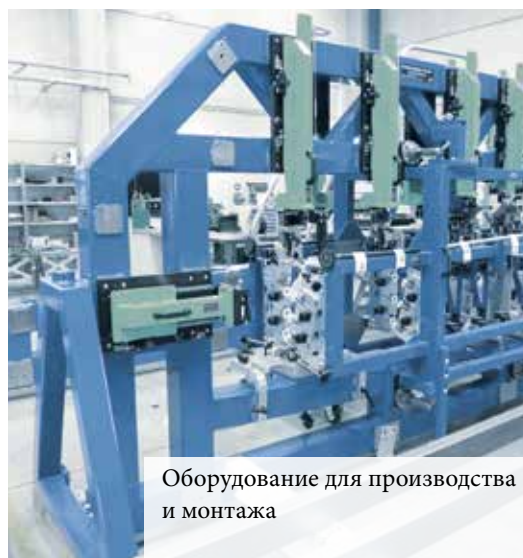
Оборудование для производства и монтажа