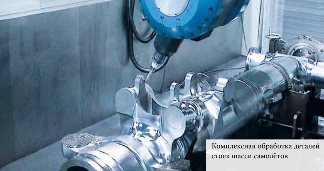
Комплексная обработка деталей стоек шасси самолётов